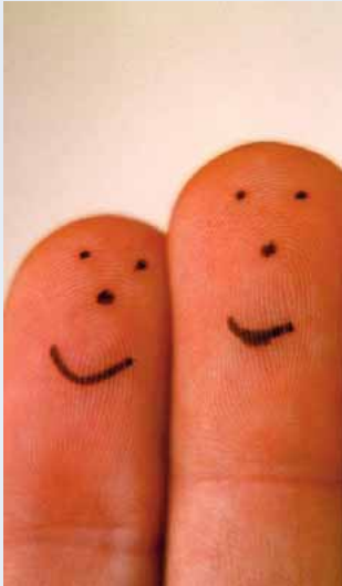
Die MediPäds - echte Teamarbeit

Die MediPäds sind Teams aus Lehrern (meistens Lehrerinnen) und Ärzten (meistens Ärztinnen)*, die gesundheitsfördernde Unterrichtsprojekte entwickeln und umsetzen.