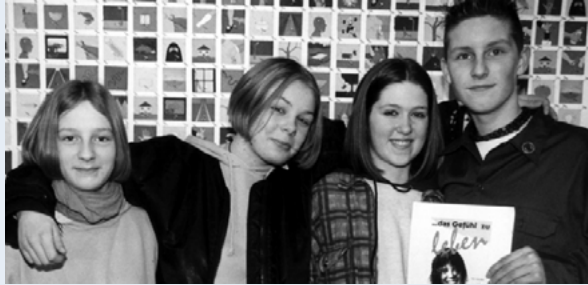
Thema Gesundheit im Unterricht - mit Spaß!

Der Schwerpunkt der MediPäds-Projekte liegt auf Gesundheit statt Krankheit; auf Spaß statt Abschreckung. Der Erfolg: Die Kinder und Jugendlichen identifizieren sich mit den Themen. Und sie sind begeistert von den ungewöhnlichen Unterrichtskonzepten.