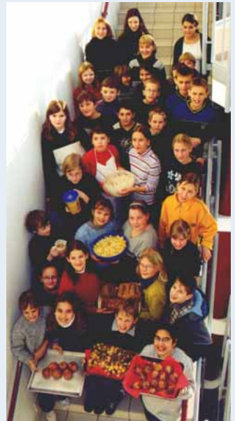
Die Klasse 5d präsentiert selbstentwickelte Pausensnacks

Wir von der Medusana Stiftung sind jederzeit als erfahrene Ansprechpartnerinnen für die MediPäds da. Zudem stehen die Teams untereinander im Dialog. Sie tauschen Erfahrungen, Anregungen und sogar ganze Projekte aus, die dann für die nächste Schule modifiziert oder weiterentwickelt werden.